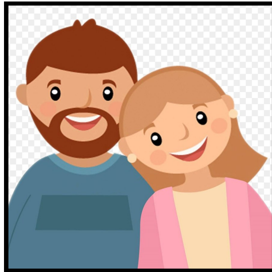
Mamá y Papá